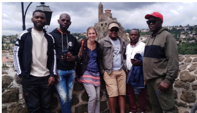
Sortie au Puy