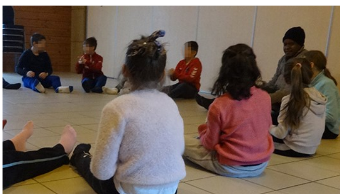
Musique et danse, A. partage ses passions