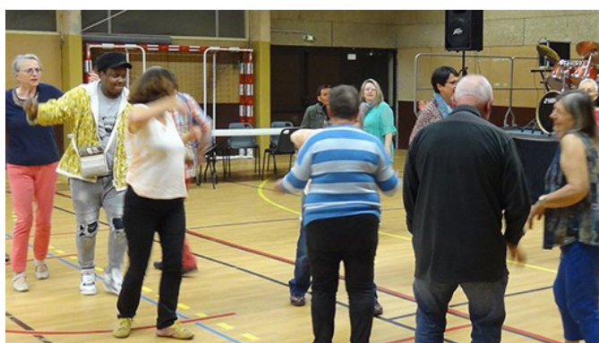
Repas CBSO: Ce jour est-il un jour spécial ?