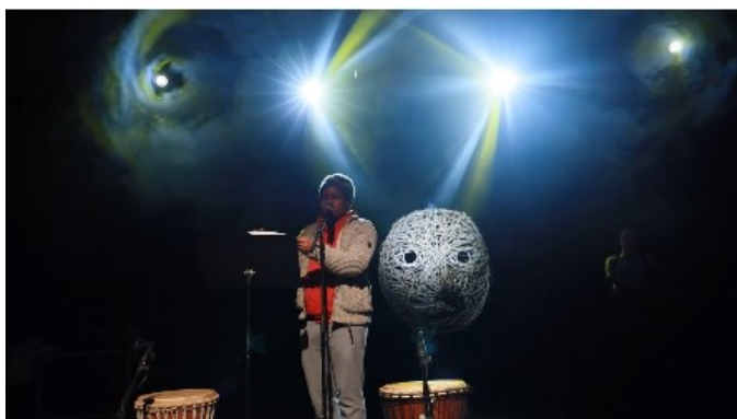
Festival des solidarités 2024