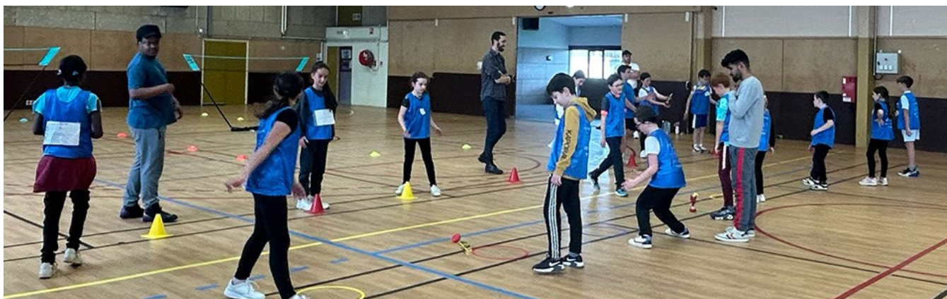
Journée olympique le jeudi 4 avril