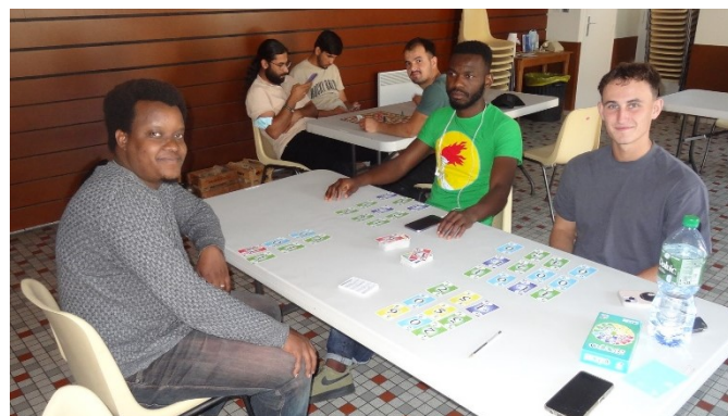
Après-midi Jeux à Lubilhac