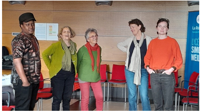
La Loco avec Unis Cité et le Greta du Velay au Lycée Simone WEIL