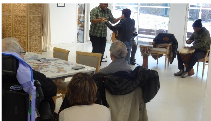
Ça swingue à l'EHPAD St-Dominique