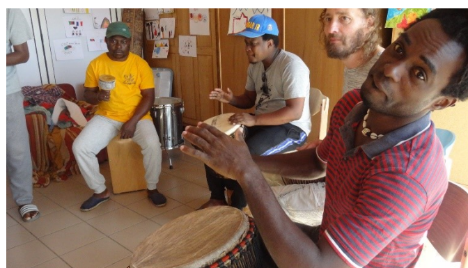
Les adhérents de La Loco en stage avec Niarmy trio