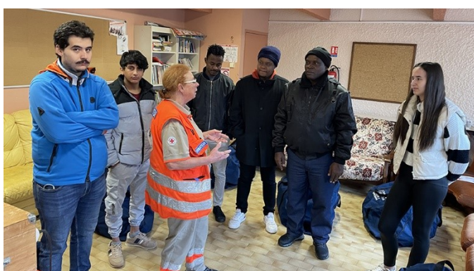
Nouvelle Formation PSC1 par la Croix Rouge