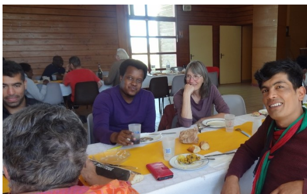
La Fête à la patate