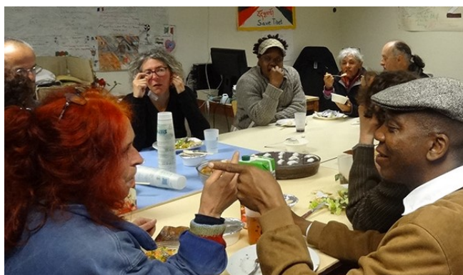
Fête des Jardins contre vents et marées