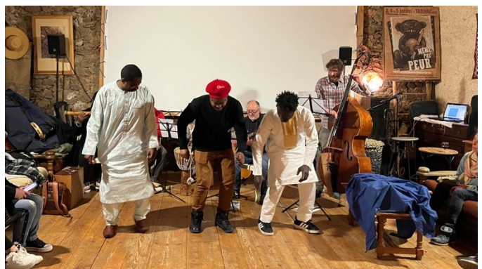
La Loco "met le feu" à la Grange à Palabres